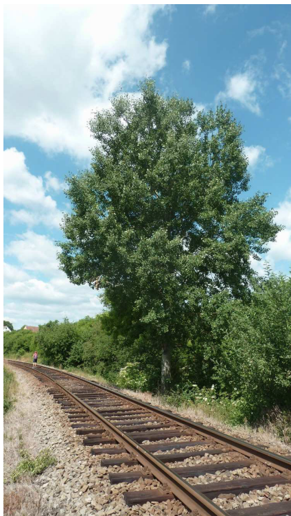
Inv. č. 72 – Populus tremula