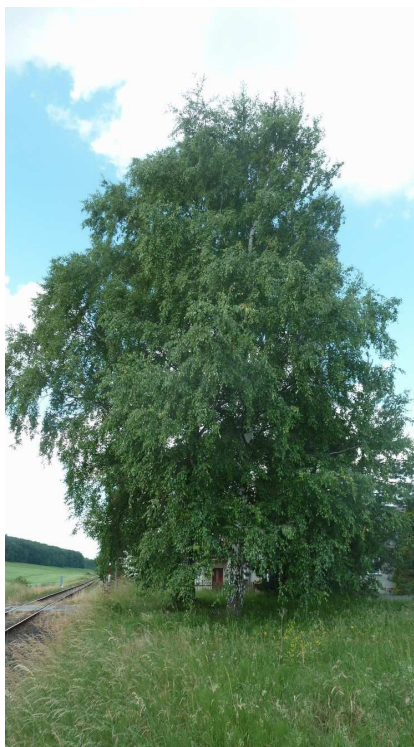
Inv. č. 63, 64 – Betula pendula