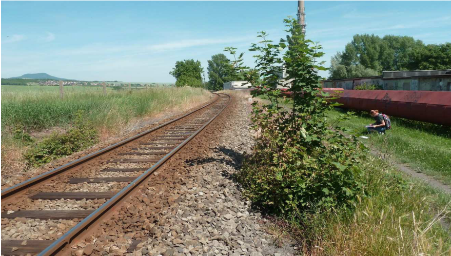
Inv. č. 18 – Acer pseudoplatanus