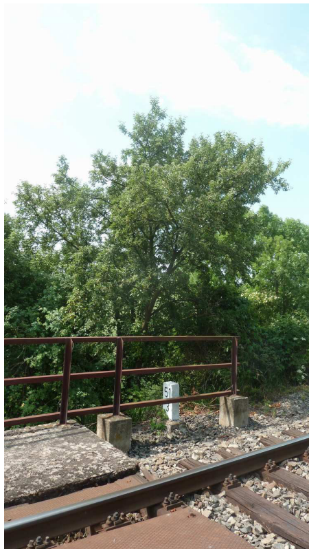
Inv. č. 45 – Malus domestica