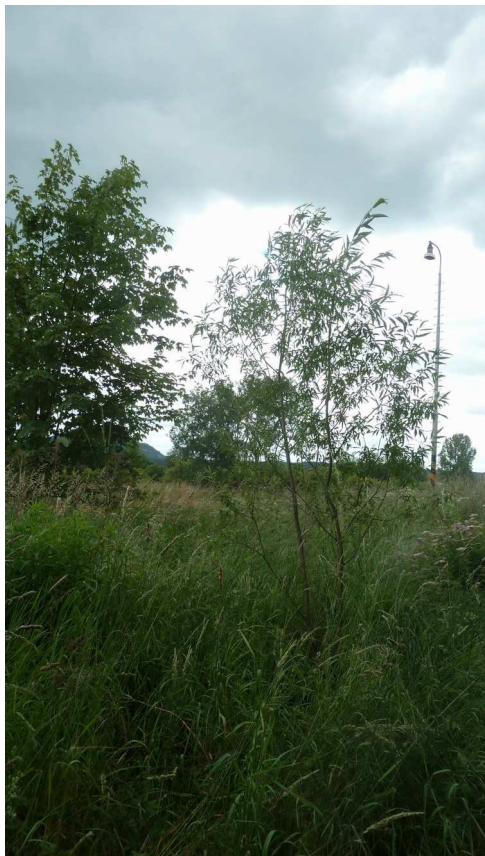
Inv. č. 113 – Salix sp.