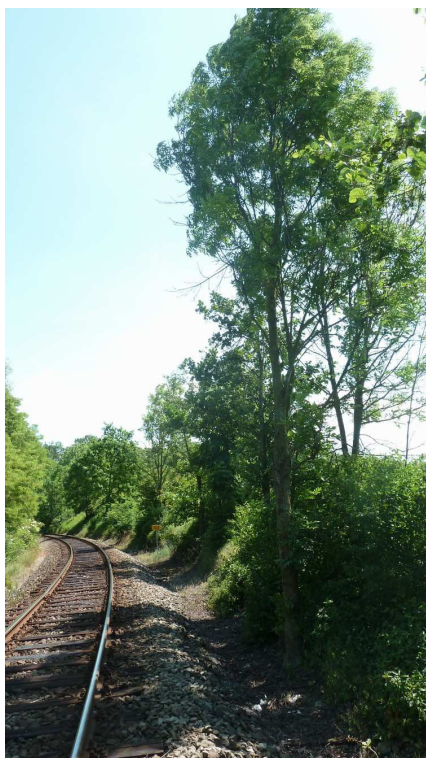
Inv. č. 56 – Fraxinus excelsior