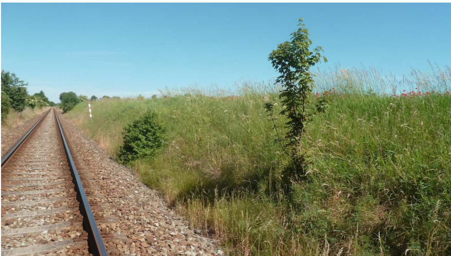
Inv. č. 24 – Acer platanoides