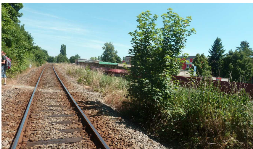
Inv. č. 17 – Acer platanoides