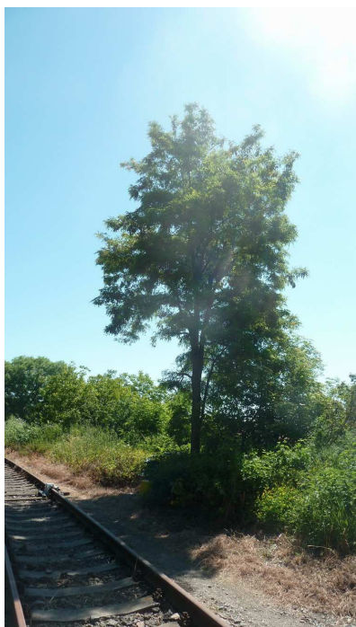
Inv. č. 1 – Robinia pseudoacacia