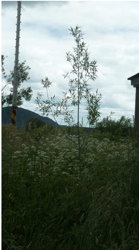
Inv. č. 114 – Salix sp.