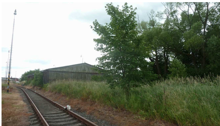
Inv. č. 112 – Acer pseudoplatanus