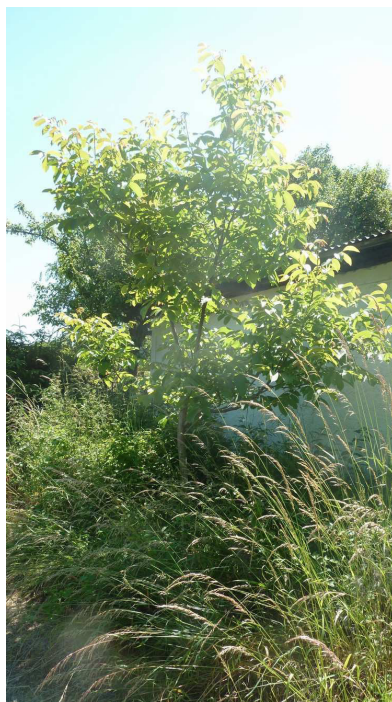
Inv. č.4 – Juglans regia