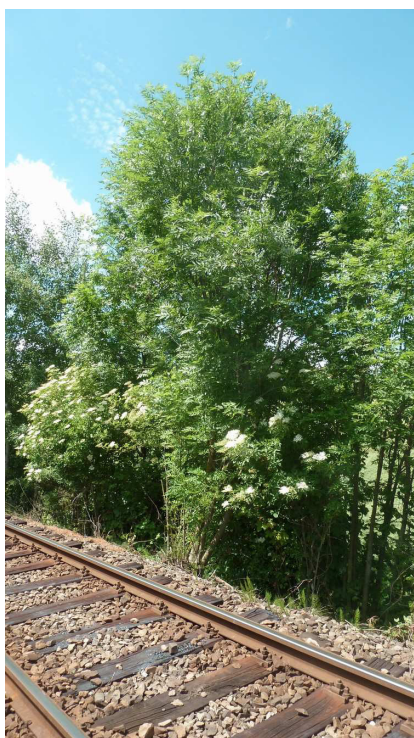
Inv. č. 75 – Fraxinus excelsior