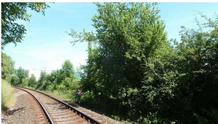
Inv. č. 14 – Malus domestica