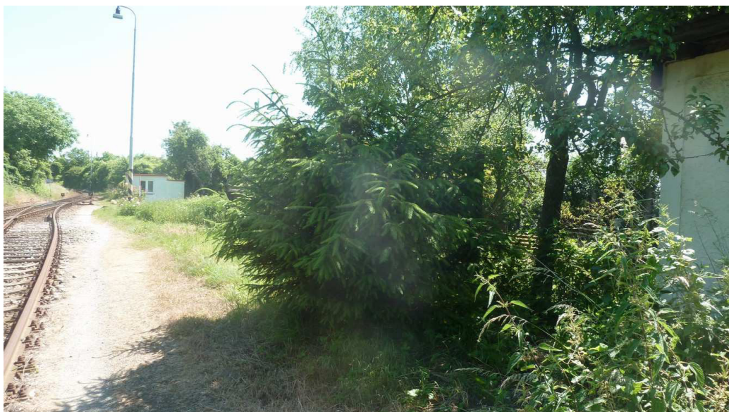
Inv. č. 5 – Picea pungens