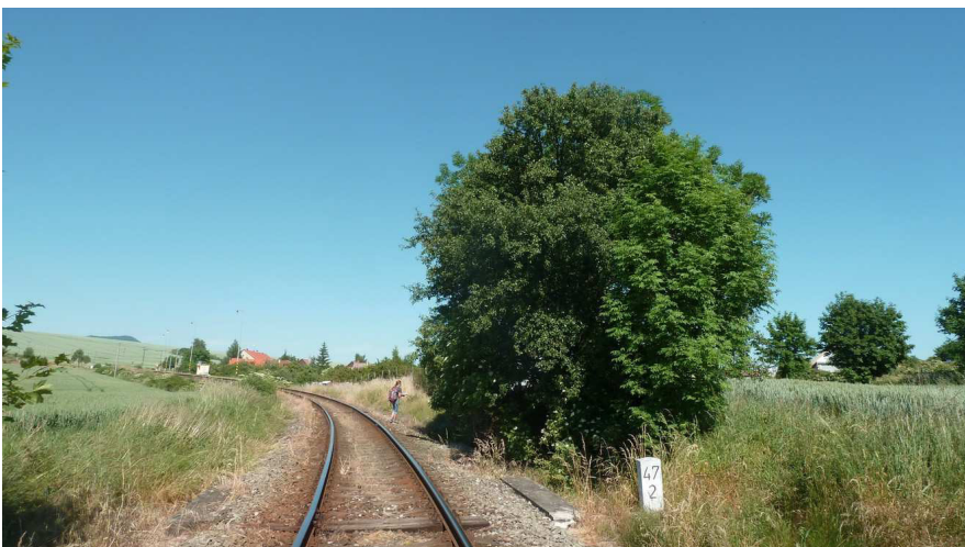
Inv. č. 30 – Pyrus pyraeaster