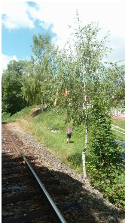
Inv. č. 74 – Betula pendula