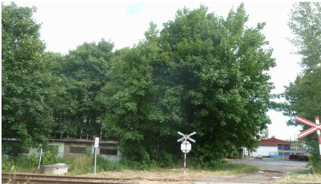
Inv. č. 139, 140 – Acer pseudoplatanus