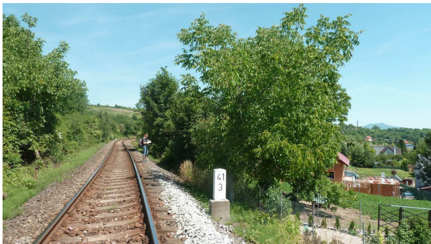
Inv. č. 7 – Juglans regia